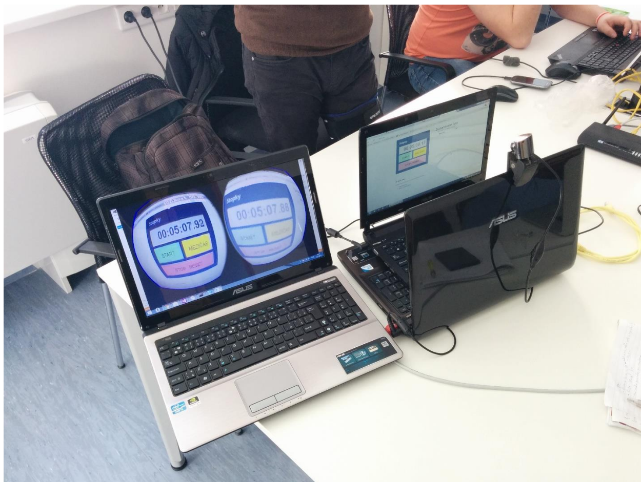
Obrázok č.1: Na obrázku je znázornené testovanie pomocou externej kamery a PC kamery.