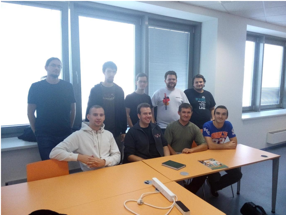
Spracoval: Martin Kyseľ