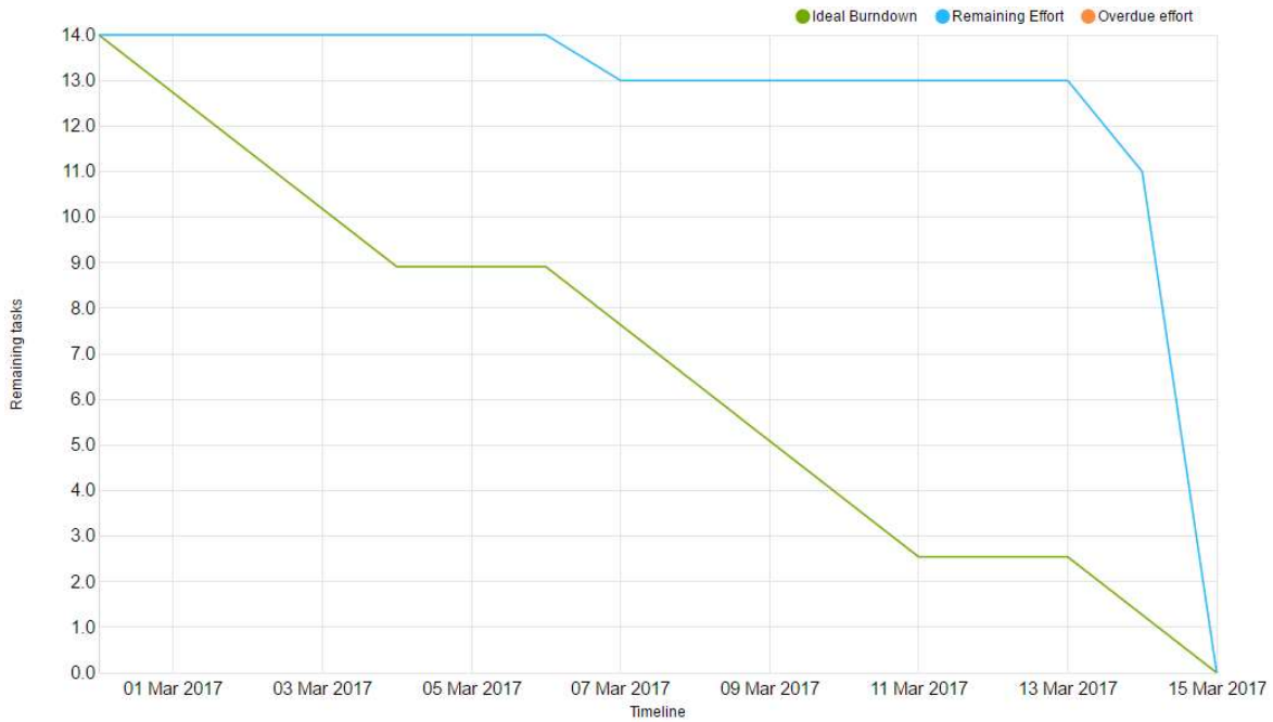
Obr. 28: Burn-down chart

Odhadované plnenie úloh tímu počas tohto šprintu znázorňuje zelená krivka. Reálne plnenie úloh je znázornené modrou krivkou. Graf obsahuje okrem úloh aj používateľské príbehy. Tento šprint sme jeden user story, ktorý obsahoval jednu úlohu zrušili z dôvodu, že do hry nakoniec nejdeme.